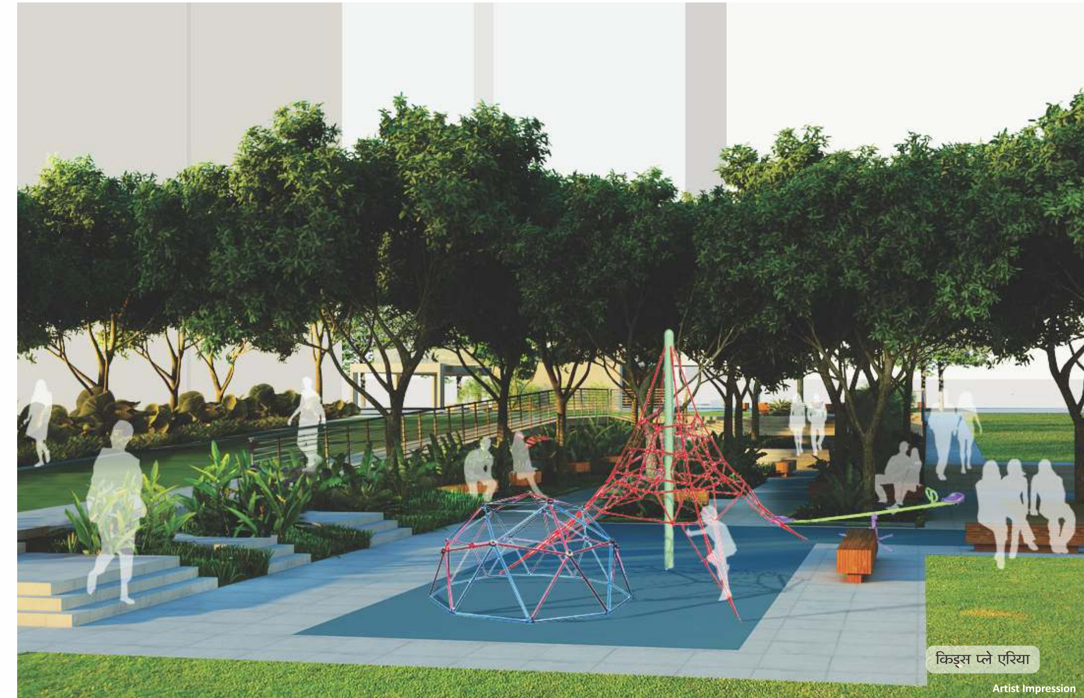
किड्स प्ले एरिया